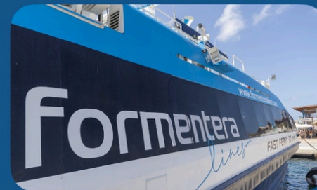
AIRES DE FORMENTERA