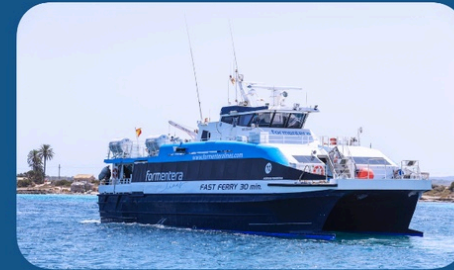
AIGÜES DE FORMENTERA